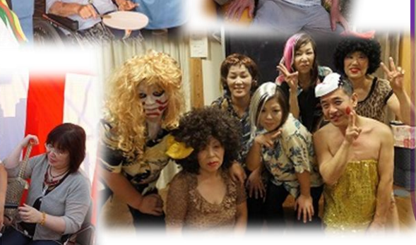
毎度お騒がせビックリショー♪