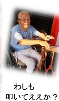
わしも叩いてええか？