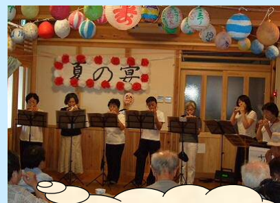
オカリナの 音色にウツリ...