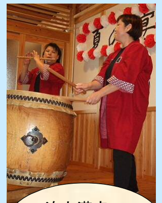
迫力満点! 和太鼓と篠笛