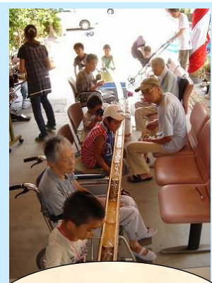
恒例の流し素麺 みんな真剣!

8月16・17日、愛宕の家で「夏の宴2008」が開催されました。夏の暑さを吹き飛ばす程、元気に楽しく賑やかに過ごしました。参加して下さったボランティアの方々やご家族の皆さんに助けを頂きながら、無事に終了することが出来ました。ありがとうございます。ほんの一部ですが、楽しかったひと時を写真で紹介します。