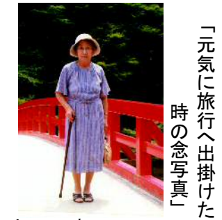
「元気に旅行へ出かけた時の念写真」

「タクシーを利用してよ!」という子供達の声も「もったいないから..。」と受け付けず、バス停までの長い長い坂道を行き来し、バスの乗降や車中の不安定さによる転倒事故などを繰り返した結果、皆が心配していた疲れがたまってしまう入院することになってしまったのです。