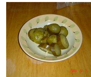
キュウリのぬかづけ