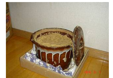
乳酸菌がいっぱいのぬか床ちゃん