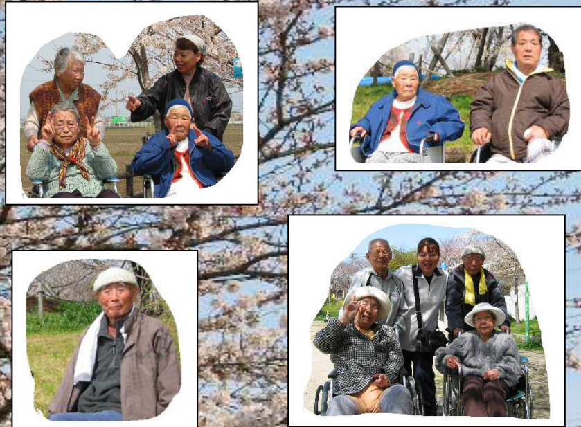
デイ・サービス利用状況 (定期利用者数)